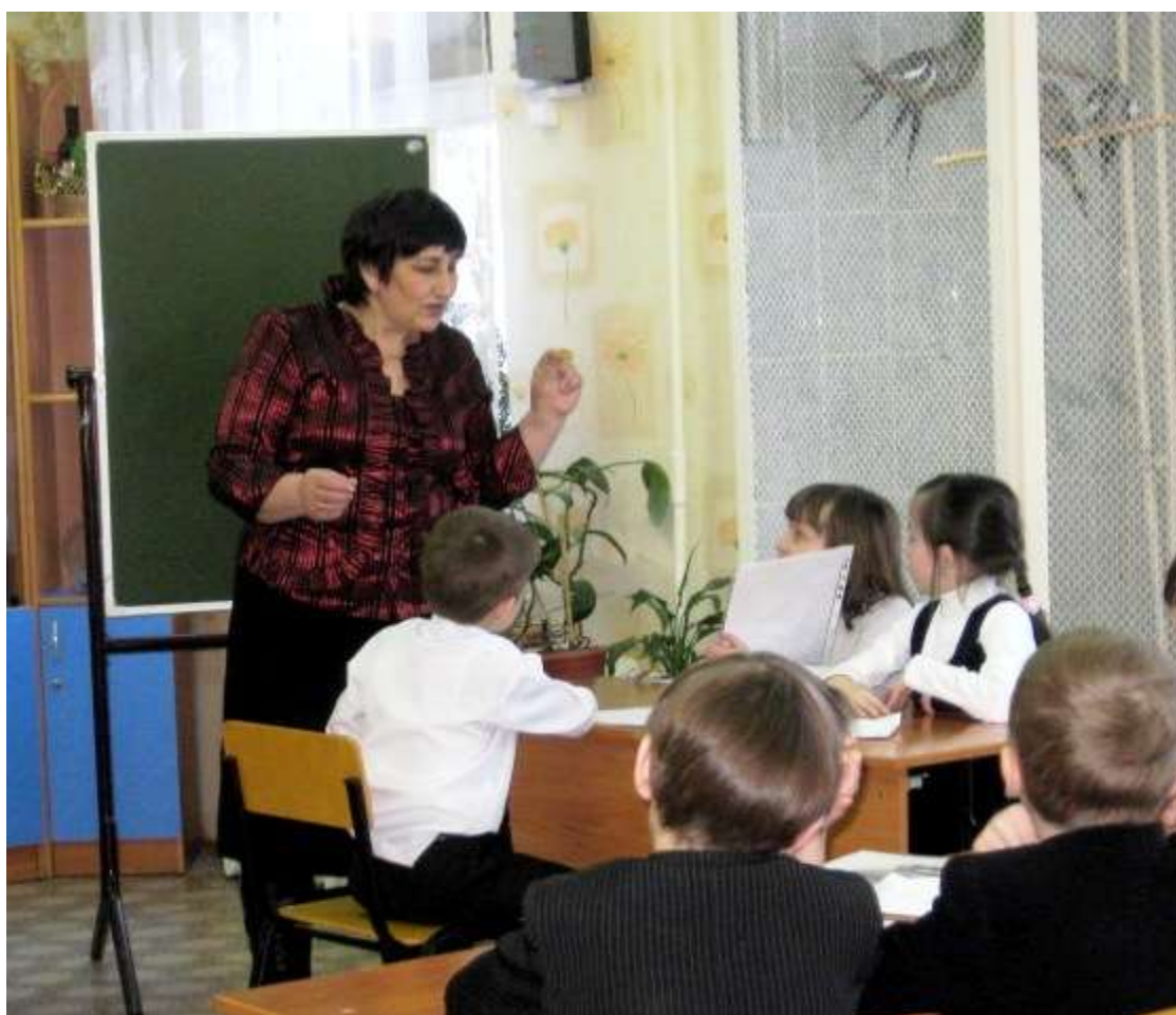
Рис. № 1 Дети рассказывают о сове.

Старинная легенда гласит, что когда Иисуса Христа распяли на кресте, к нему прилетела эта птичка и стала клювом вынимать колючки из тернового венца, пыталась вытащить и гвозди, которыми были прибиты к кресту руки и ноги Христа. Но это оказалось ей не под силу, и кончик клюва у этой птицы перекрестился, а перья испачкались кровью и стали красными. За это в некоторых странах этих птиц зовут христовыми птицами: