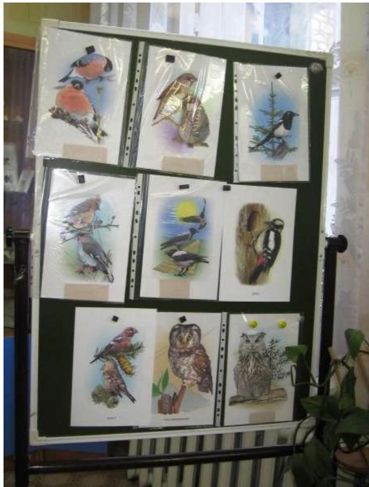
Рис. № 9 Подсказка на доске.