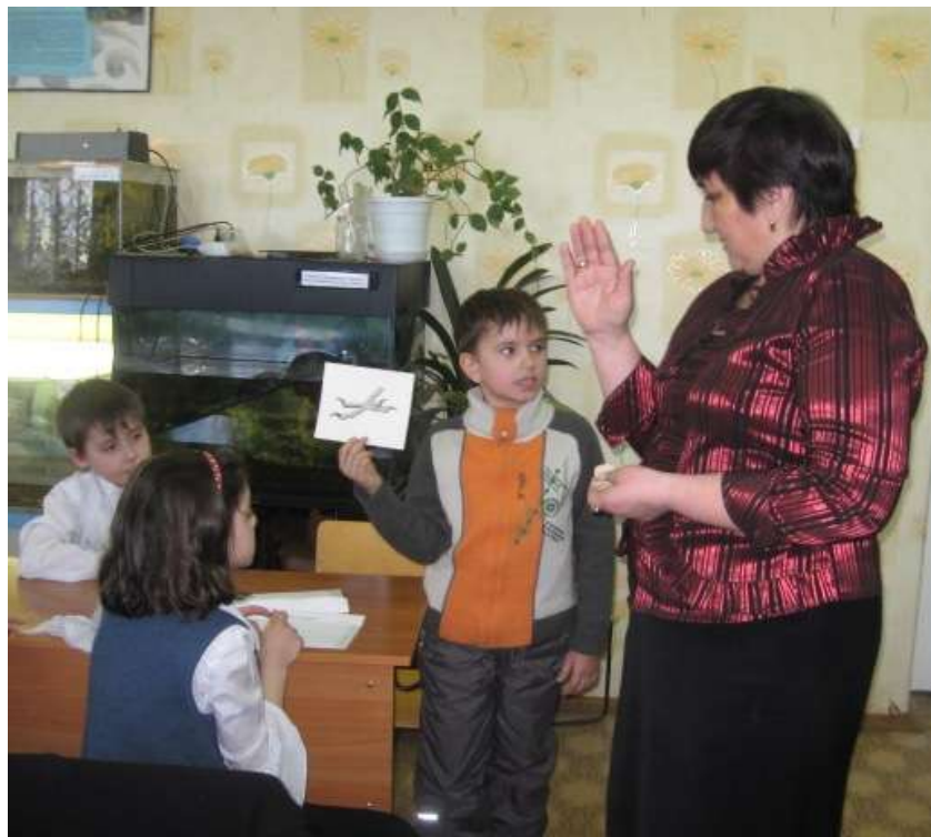
Рис. № 3. Это – лапа дятла.

Задание 3. Определи меня. (дети на группу получают в конвертах задание по клюву, по лапе и по голове определить как называется птица.)