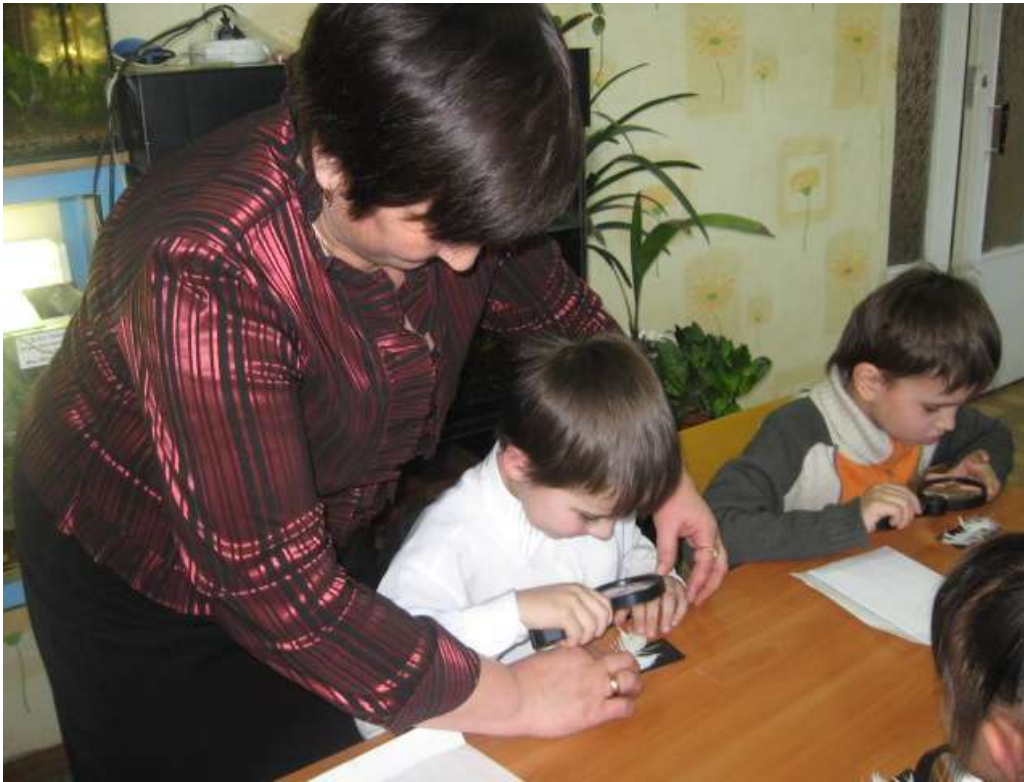
Рис. №.№ 10, 11 Дети через лупу рассматривают строение птичьего пера.

Задание 4. Разминка. Всем нужно прослушать вопрос и ответить: бывает так или не бывает.