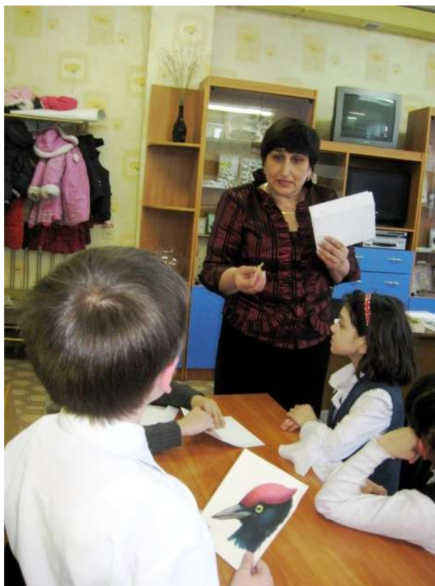
Рис. № 4. Это - голова дятла.

Задание 4. Собери меня.(Каждый ученик получает в конверте разрезанный рисунок птицы, должен сложить и назвать птицу.) Вспоминаем, какие птицы еще зимуют с нами и как, и где добывают они себе корм.(свиристели, снегири, сороки, вороны, галки, воробьи, синички, голуби). (Если не справляются ребята, то для подсказки на доске развешиваются целые картинки птиц.)