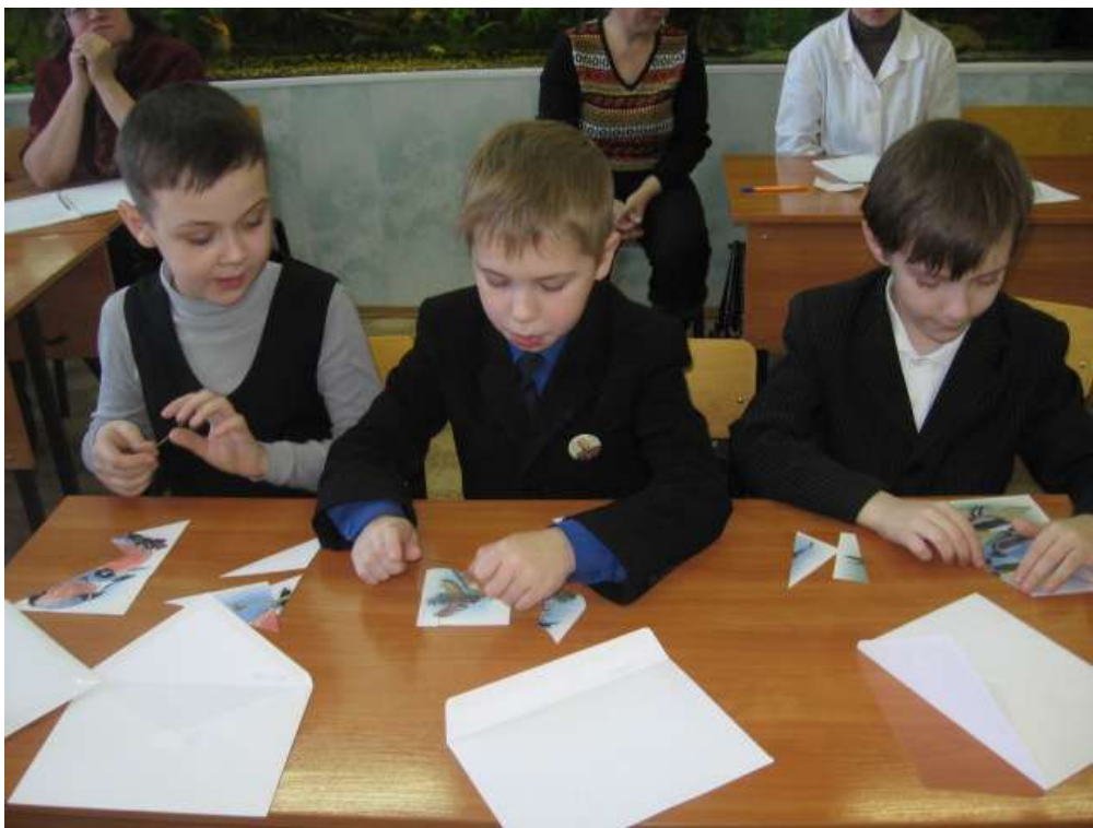
Рис. № № 5,6,7.- дети собирают рисунки птиц.